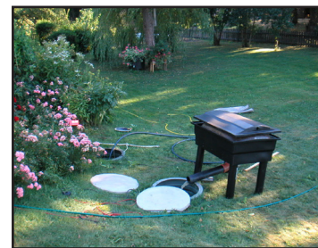
Produkten levereras i färgen grön.