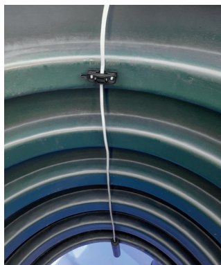
Placering i stos