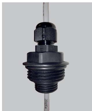
Montering i ST3000Ls sker med genomföring FANN art nr 3806 i hål på tankens ovansida