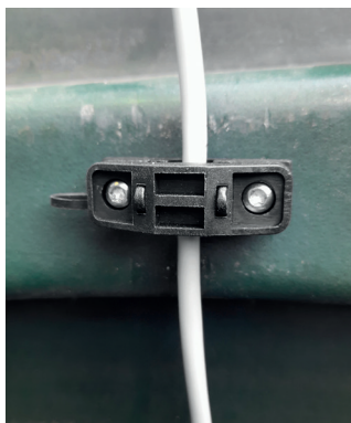
Montering av klämfäste

Placeringen ger ett enkelt montage och det är lätt att justera nivån och att vid behov rengöra givaren. För tekniska data se separat anvisning.